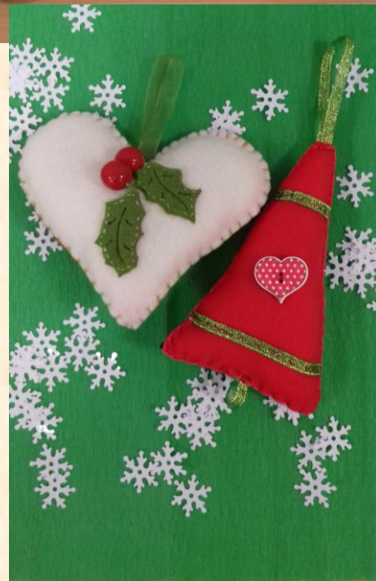
Przedmioty z licytacji – 4 zdjęcia