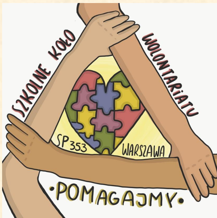
Logo SKW – 1 zdjęcie