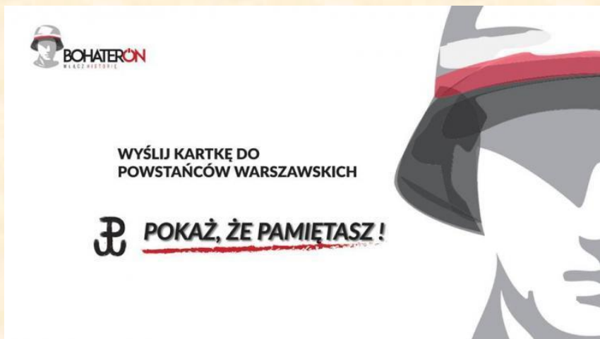
Kartka BohaterON – 1 zdjęcie

Kolejna inicjatywa to włączenie się do ogólnopolskiej kampanii o tematyce historycznej BohaterON – włącz historię! Ma ona na celu upamiętnienie i uhonorowanie uczestników Powstania Warszawskiego. W tym roku poproszono nas o przesłanie wspólnie wykonanej pamiątki z życzeniami. Szkolni wolontariusze przygotowali kalendarz na rok 2021.