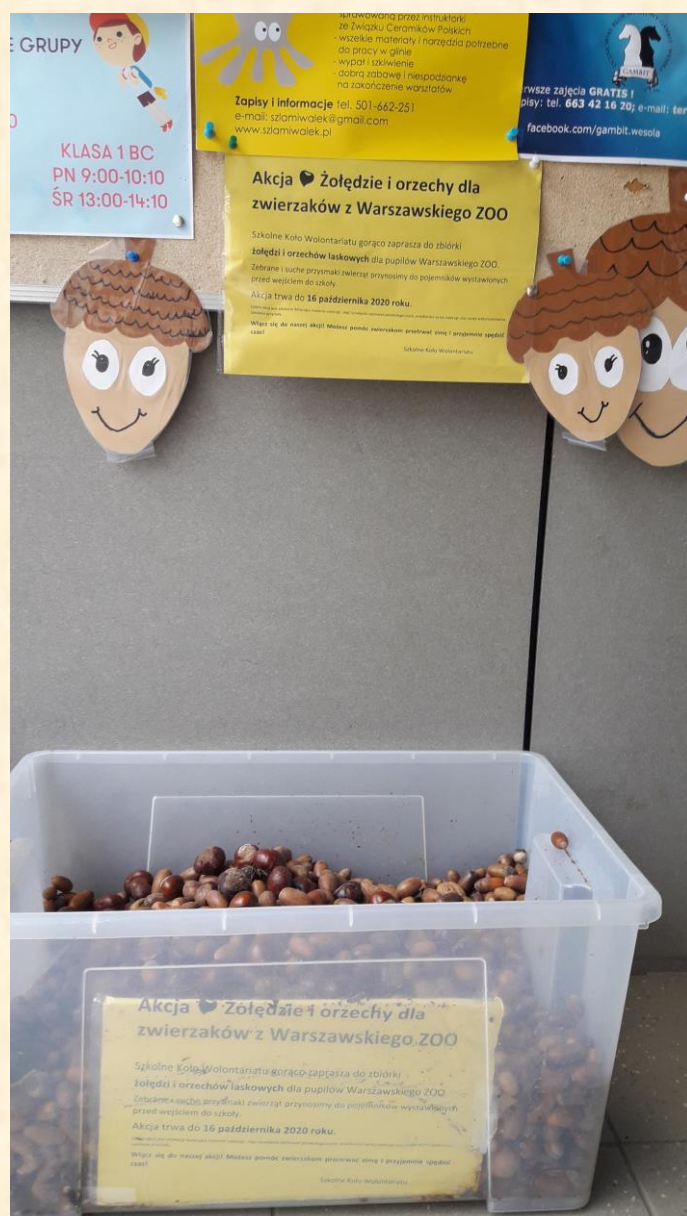
Nasza zbiórka – 1 zdjęcie