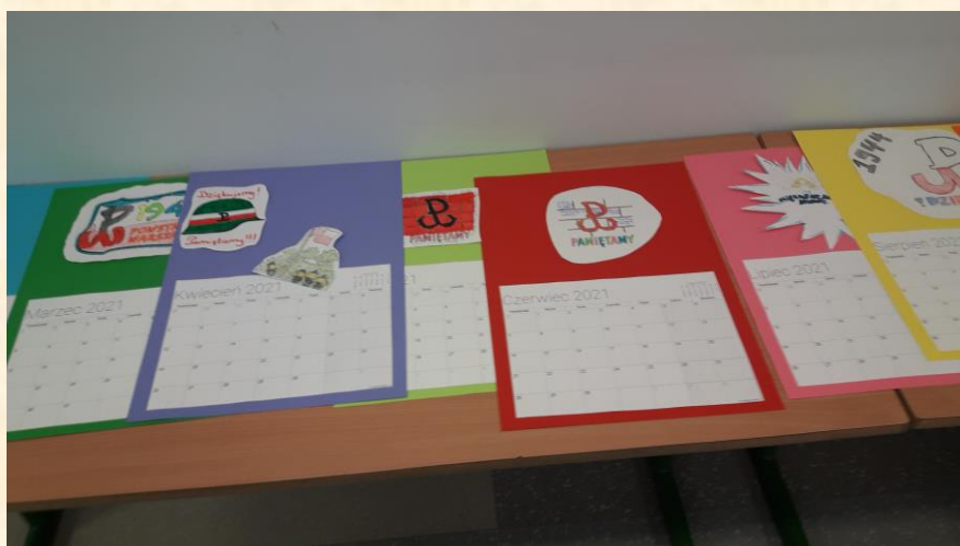
Kalendarz – 1 zdjęcie