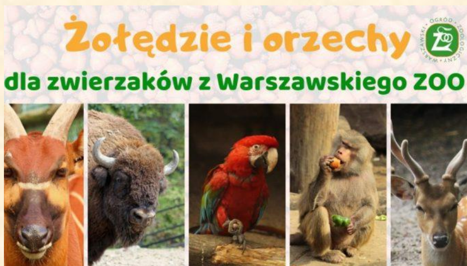
Plakat – 1 zdjęcie

W październiku zorganizowano zbiórkę żołądźi i orzechów laskowych dla pupilów Warszawskiego ZOO. Pomoże to przetrwać zimę zwierzacom, a nam dało okazję do jesiennych spacerów.