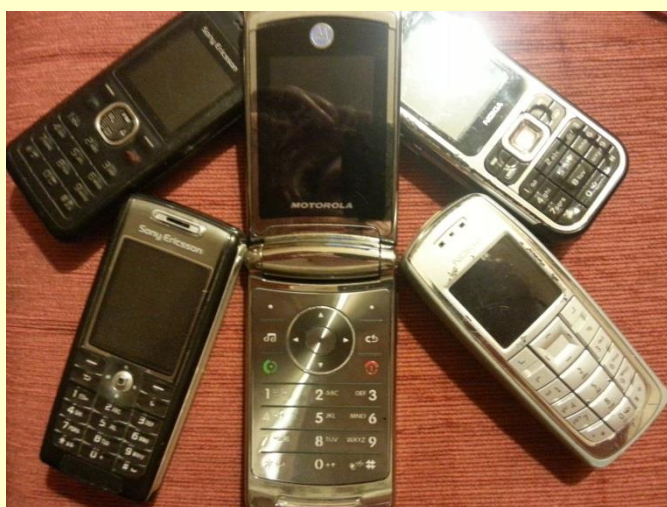
Komórki, które zebraliśmy w akcji