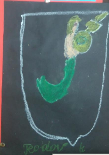
Teodor Kutek - kl. 1b