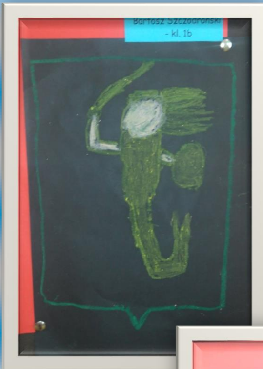
Bartosz Szczodronski - kl. 1b