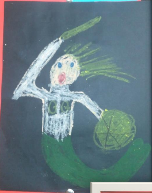
Szymon Bojar - kl. 1d