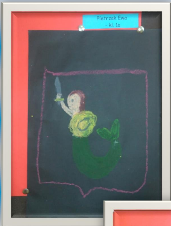
Pietrzak Ewa - kl. 1a